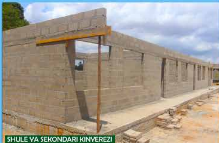
SHULE YA SEKONDARI KINYEREZI