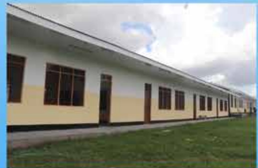
Ujenzi wa shule mpya ya Sekondari Bwawani iliyoipo kata ya Kiwalani