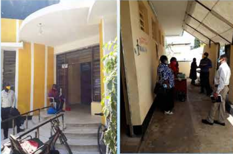
Wakaguzi kutoka Ujenzi, Afya na Fedha wakikagua hali ya ukarabati wa Choo cha Mkunguni, Lumumba na Karume.

Kunawa mikono ni muhimu wakati wa kuandaa chakula Pia mlo kamili ni muhimu ukijumuisha nafaka, jamii ya kunde, mboga za majani, mafuta na matunda.