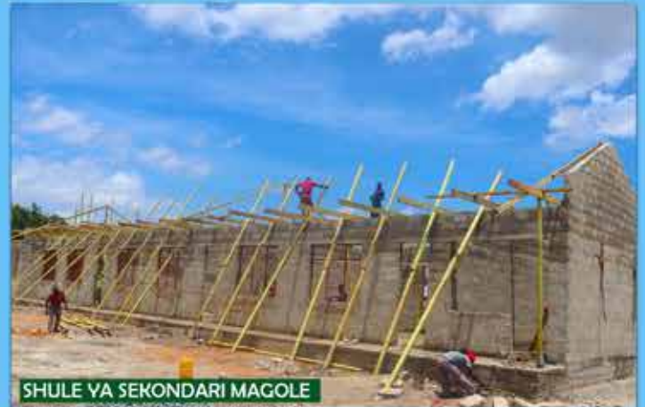
SHULE YA SEKONDARI MAGOLE