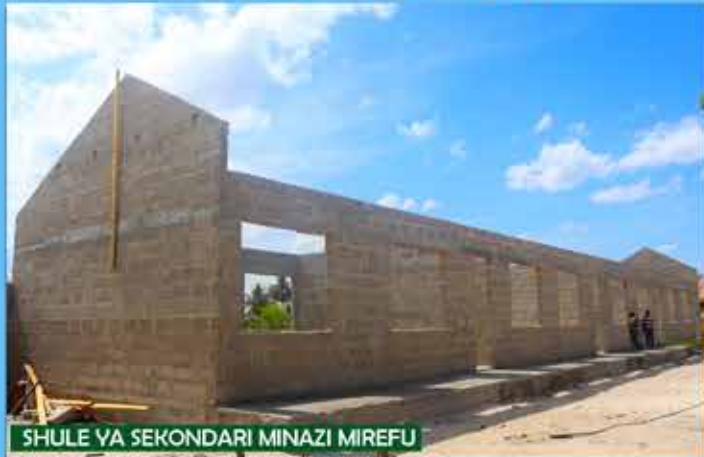
SHULE YA SEKONDARI MINAZI MIREFU

Halmashauri ya Jiji la Dar es Salaam tunakushukuru sana Rais wa Jamhuri ya Muungano wa Tanzania Mhe. Samia Suluhu Hassan kwa Mgao wa Fedha Tshs Bilioni 5.1 kwa ajili ya ujenzi wa vyumba vya madarasa kwa shule za Sekondari