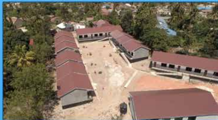
Shule ya Msingi Gulukakwalala

Sambamba na hilo kiasi cha shilingi Milioni 164.7 zimetumika katika ujenzi wa matundu 161 ya vyoo katika shule za Msingi kwa kipindi cha January hadi Juni 2021 ambapo matundu 84 ya vyoo yenye thamani ya shilingi Milioni 80 ikiwa ni fedha kutoka mapato ya ndani ya Halmashauri na wadau mbalimbali wa maendeleo(SOS) yamekamiliika huku matundu 77 ya vyoo yenye thamani ya shilingi Milioni 84.7 ikiwa ni fedha za ruzuku kutoka Serikali kuu(EP4R) ujenzi unaendelea.