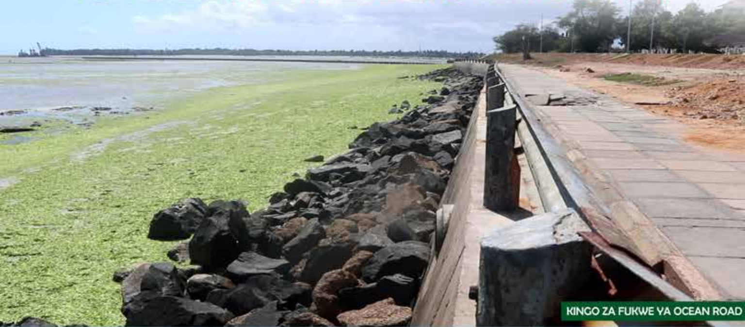
KINGO ZA FUKWE YA OCEAN ROAD