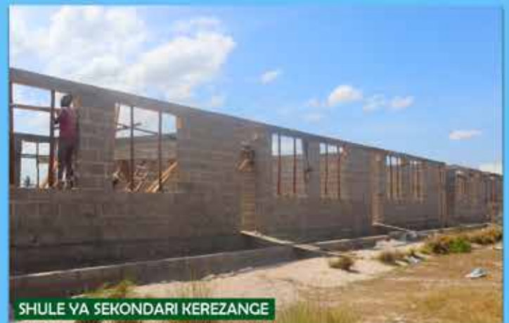
SHULE YA SEKONDARI KEREZANGE